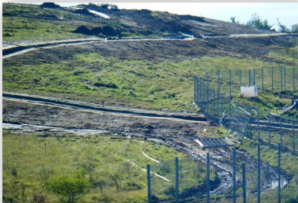
Se emplearon más de 1736m de SmartDitch en este vertedero en el Reino Unido para corregir los problemas de escorrentías y erosión causados por el desbordamiento de agua de la cima.

Representante de ventas en el Reino Unido: Somerville Marketing - Ontario, Canadá