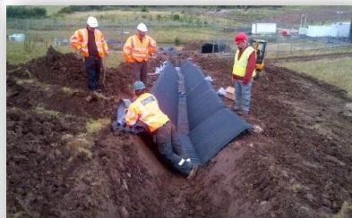
El equipo de construcción instaló 1736 m de SmartDitch en 8 semanas (incl. retrasos por causas climatológicas).