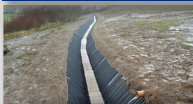
SmartDitch ya está funcionando a pleno rendimiento incluso antes finalizar su instalación.